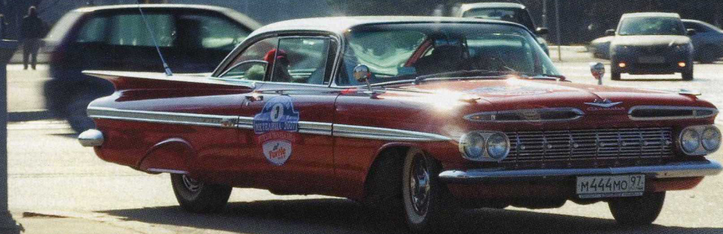
Valoisa Chevrolet Impala HT 1959 taustanaan synkkä Stalinin ajan rakennus.