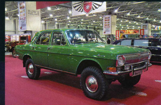
Nelivetoinen Volga eli GAZ-24-95 4x4. Kyllä, se on tehdastekoinen ja alkuperäinen. Vain kahden auton väitettiin säilyneen. Tämä kyseinen yksilö oli messujärjestäjän mukaan Leonid Brežnevin mökkiauto.