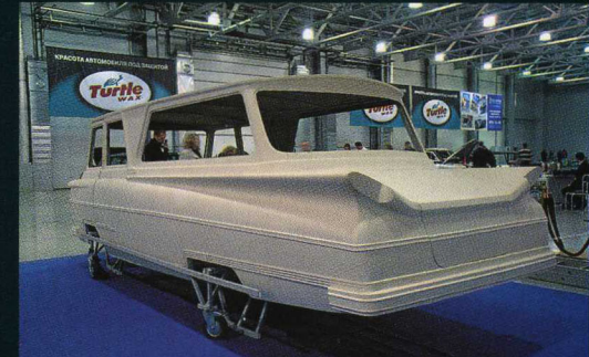
Start-pikkubussin kori entisöinnissä. Pohjoisdonilainen ajoneuvojen korjauskeskus valmisti vuodesta 1964 alkaen pienehkön "teollisen määrän" tätä Harkovin Automaantieteiden instituutin suunnittelemaa pikkubussia. Lasikuitukorinen, 12-paikkainen kulkine jäi harvinaisuudeksi.