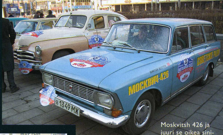
Moskvitsh 426 ja juuri se oikea sinisen sävy.