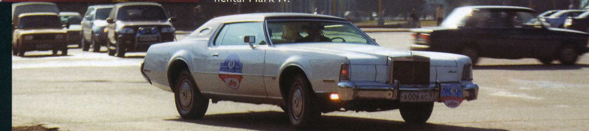
Yksityisetsivä Cannon on näköjään saanut toimeksiannon kauas kotoa. Lincoln Continental Mark IV.

Salainen agentti töisään joskus kylmän sodan aikaan. No, ehkä punaiset liput tällä kertaa mainostavat paikallista laajakaistaoperaattoria. Herra Bond ei myöskään ole koskaan oikein suosinut Mercedes Benz 190SL:ää.