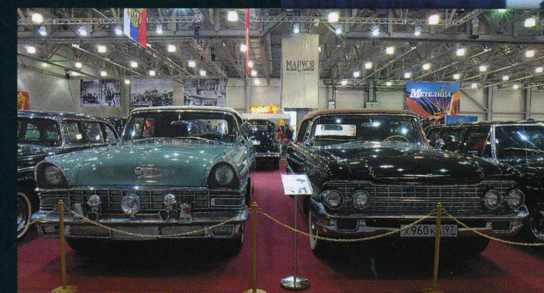
Oikeanpuoleinen avoauto on ZIL-111D 1967, jonka Erich Honecker sai Leonid Brežnevilta. Samassa autossa hän näyttäytyi Fidel Castron kanssa vuonna 1974. Vasemmalla ZIL-11V, jolla Juri Gagarin vietiin Kremltiin huhtikuun 14. 1961, kaksi päivää ensimmäisen avaruuslennon jälkeen.