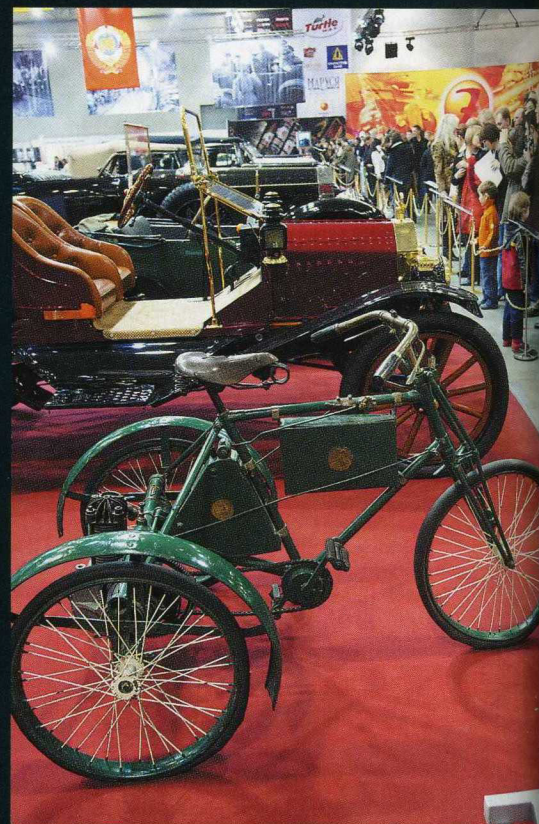
Moottorikolmipyörän valmistajaksi ilmoitetaan saksalainen Coudell ja vuodeksi 1900. Kuin luotu lappuliisan työkaluksi.

teksti: Janne Halmkrona