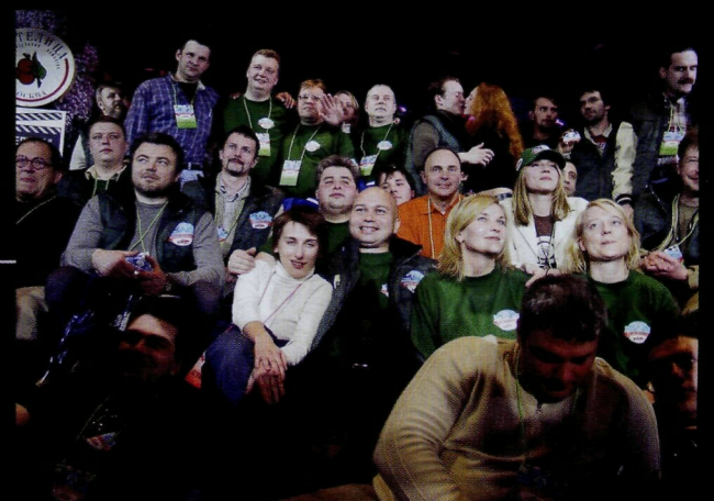
Участники ралли Олдтаймер-2007