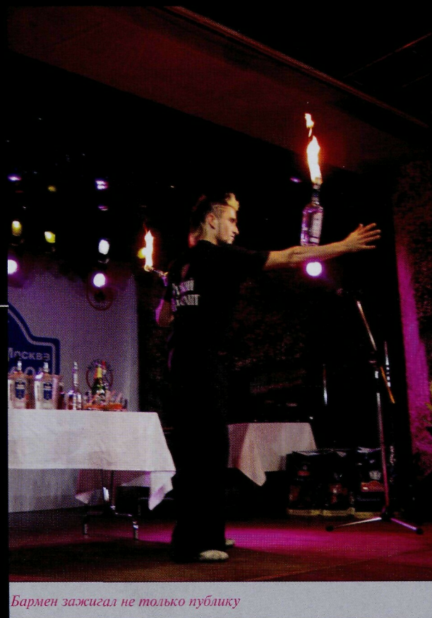
Бармен зажег не только публику