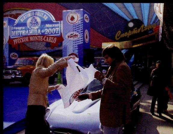
Даже таким машинам нужны опознавательные знаки