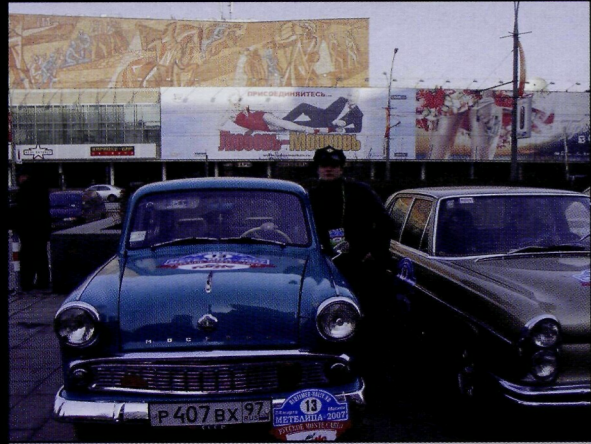
Новый москвич на Москвиче старом