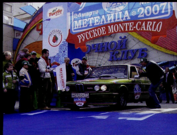
А старт дает самый непопулярный ведущий