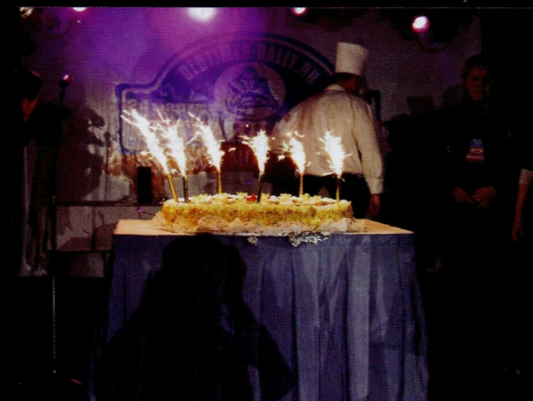
Хороший торт - хороший венец любого праздника