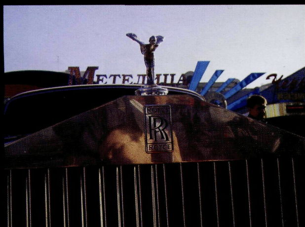
Богиня автомобилей и королева клубов