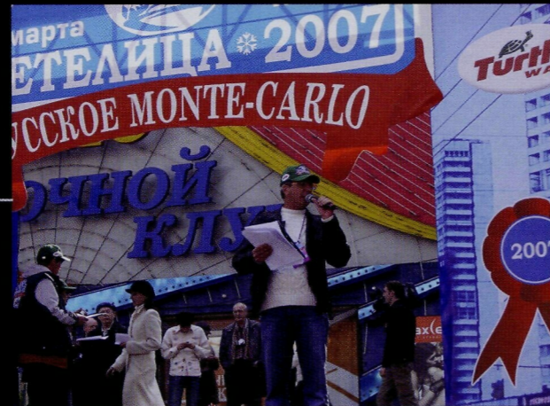
Объявляет участников популярный ведущий Алексей Лысенков