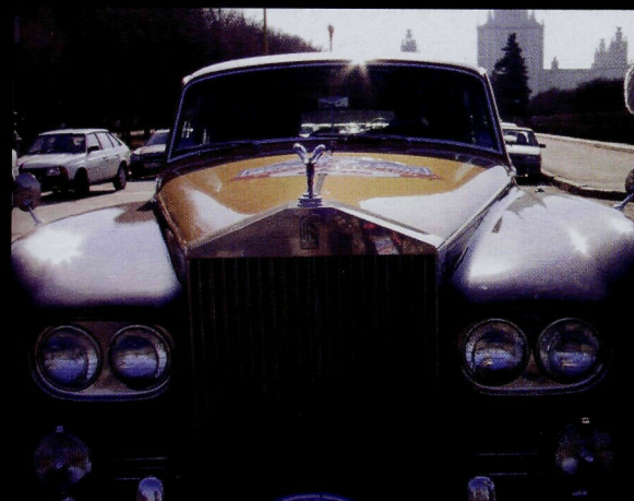
Классическое авто на фоне классического университета