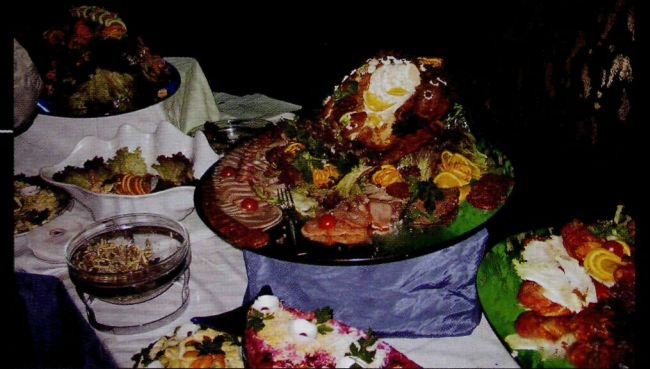
После долгой гонки неплохо бы и перекусить