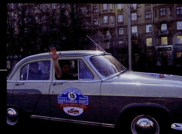
Когда еще из окон такое увидишь