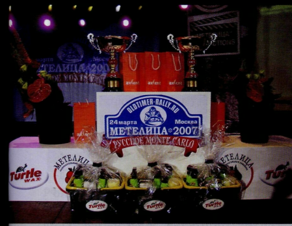
Призы долго ждали своих хозяев