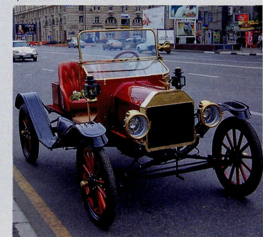
▼ Ford T — 1913 г.

летом? Это было бы грандиознейшим испытанием, которому когда-либо подвергался автомобиль...» Одним из таких смельчаков оказался итальянский аристократ князь Боргезе, который и выиграл на автомобиле Itala трехнедельный пробег по маршруту Париж — Пекин. Большая часть его проходила по территории Российской империи, где, как известно, вместо дорог — направления. Ввиду отсутствия шоссейных дорог, Боргезе ехал прямо по путям Транссибирской железной дороги. На одном из перегонов в машину чуть не врезался паровоз. После этого случая руководство Транссибирской магистрали приняло решительные меры по обеспечению безопасности итальянцев и внесло их в расписание следования поездов! По конструкции автомобили Itala были близки к грузовикам. Прочнейшая рама, огромный дорожный просвет, рабочий объем двигателя доходил до 17 л! Машины Itala оставили заметный след в истории мирового автомоби-