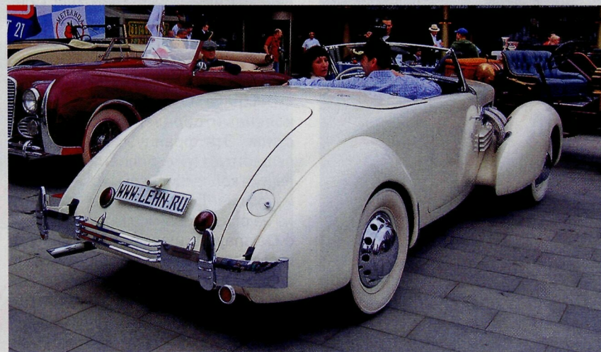
▼ Cord 812 — 1937 г.

Совсем иной имидж у другой американской марки — Cord. По конструкции и своим техническим характеристикам эти машины на десятилетия опережали мировой автопром.