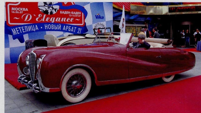
▲ Delahaye 175 — 1949 г.

Передний привод, совершенный с точки зрения аэродинамики кузов, убирающиеся фары. Фирма гарантировала, что максимальная скорость каждого автомобиля Cord будет не менее 100 миль/час (160 км/ч). Перед продажей каждый автомобиль проходил испытание на скоростном треке, после чего на нем устанавливали табличку с полученным результатом. На серийном автомобиле Cord 812 в 1937 году установлены несколько рекордов скорости, которые продержались 17 лет! Владельцами Cord были представители артистической богемы, «золотая молодежь». Страстной поклонницей этой марки была норвежская конькобежка, олим-