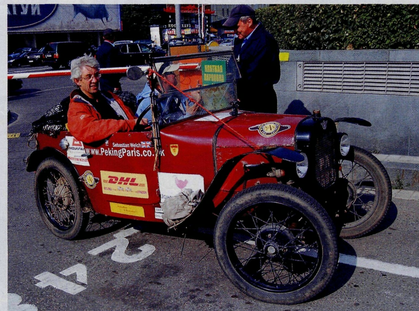
▲ Austin Seven