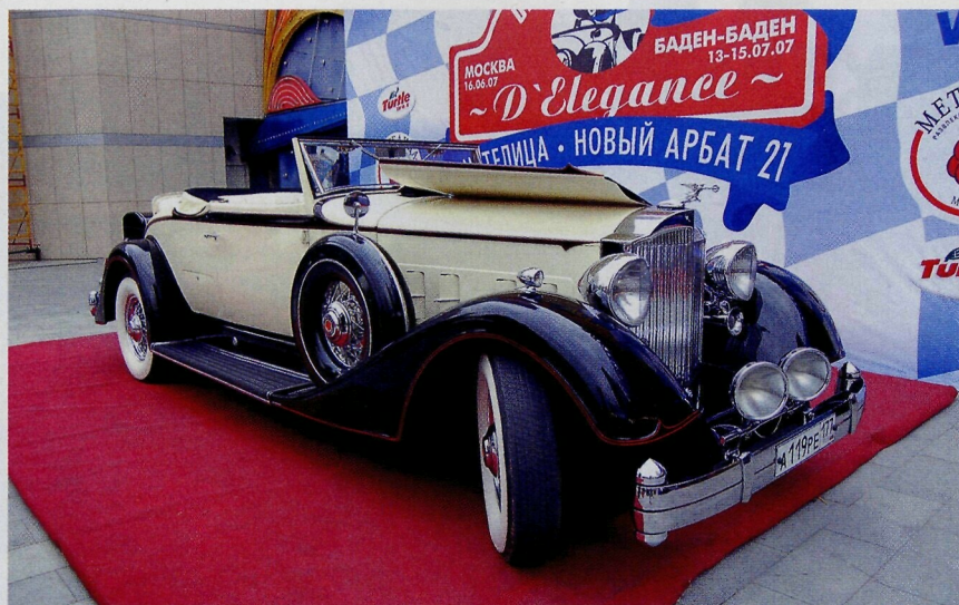
▲ Packard 1104 Super Eight Coupe-Roadster — 1934 г.