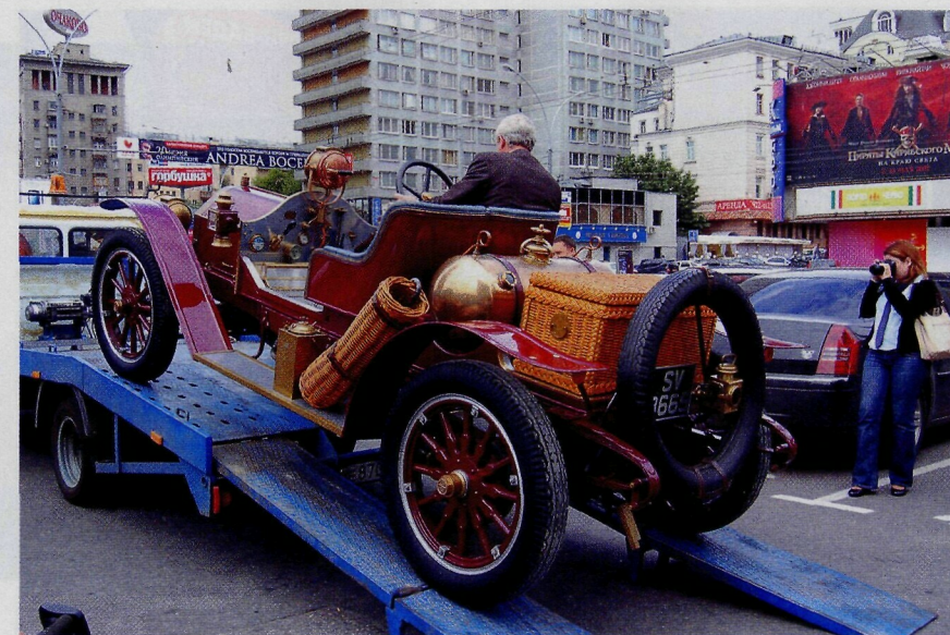
▲ Itala — 1912 г.

что небезопасно. Когда один близкий друг Лиланда увидел женщину-автомобилистку, у которой заглох мотор, то, как истинный джентльмен, сразу предложил помощь. Мотор завелся, заводная рукоятка сломала господину челюсть и руку, в результате он попал в больницу, где и скончался. Лиланд был так удручен этим происшествием, что обратился за помощью к изобретателю Чарльзу Кеттерингу. Тот и придумал электрический стартер, который с 1912 года стал устанавливаться на автомобили Cadillac, а затем уже на все остальные машины.