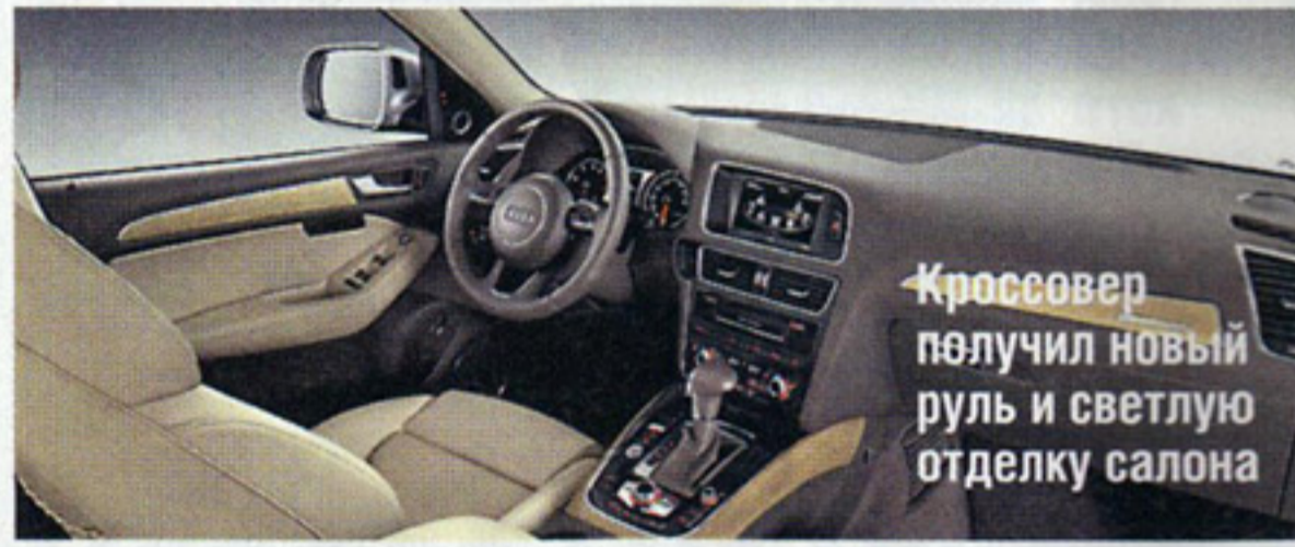
Кроссвер получил новый руль и светлую отделку салона

Компания Audi раскрасила решетку радиатора и слегка модифицировала передний бампер. Бензиновый мотор объемом 3,2 л заменили на современный 3,0-литровый мощностью 272 л.с. С ним кроссвер достигает «сотни» за 5,9 с.