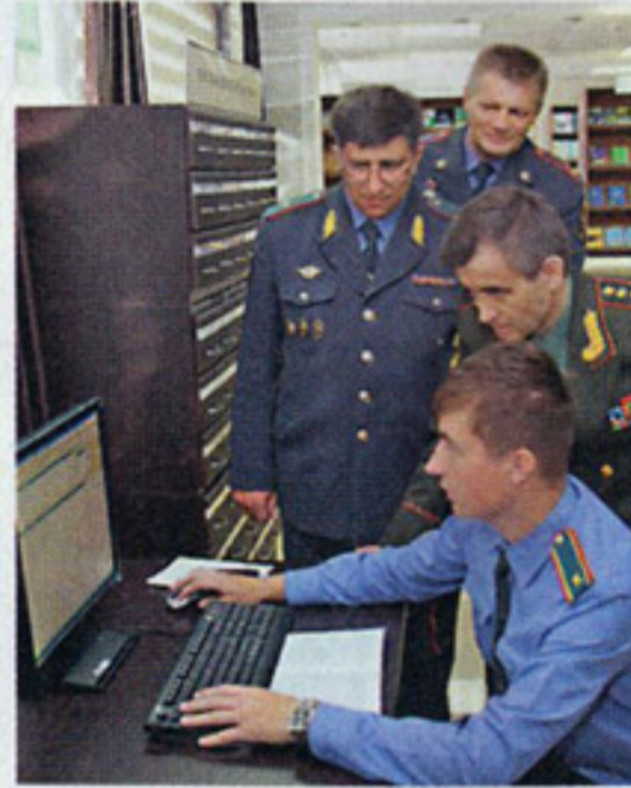
Пока ГИБДД предоставляет системе информацию о штрафах, выписанных не ранее апреля 2012 года

можно будет узнать задолго до того, как квитанция придет по почте.